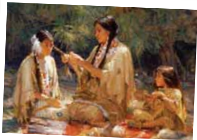
印第安人采用荷荷巴油为日常防护保养