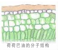
荷荷巴油的分子结构